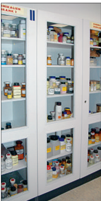
Hier gibt es die Zutaten für den anschaulichen Unterricht.

NORDEN/CFO – Die Forscherklassen der Kooperativen Gesamtschule (KGS) Hage-Norden sind dieser Tage besonders aufgekratzt. Mit viel Begeisterung durften sie die drei neuen, nach modernsten Ansprüchen eingerichteten naturwissenschaftlichen Räume in der Außenstelle Norden in der Wildbahn beziehen. Aufwendigen Versuchen steht hier technisch nichts mehr im Wege und für die Sicherheit gab es die nötigen Instruktionen für die Klasse 5d auch noch mal im Unterricht. Rund 350 000 Euro hat die Stadt Norden für diese Aktualisierung auf den neuesten Stand investiert. „Wir müssen die Ansprüche von drei Schulformen erfüllen, die hier künftig unterrichtet werden“, begründete Bürgermeisterin Barbara Schlag das Volumen (Seite 4).